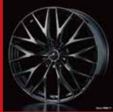
MX (ブラック/ポリッシュ)