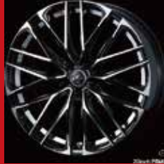
SK (ブラック/ポリッシュ)