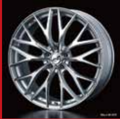
MX (シルバー/ポリッシュ)