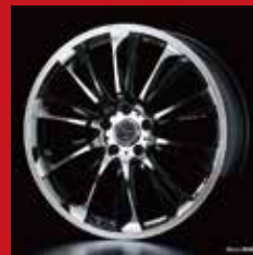
ベータ (ブラック/ポリッシュ)