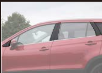
ビラー (12ヶ所) ¥52,800