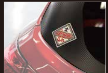
カーボンラッピングアップ画像

●料金表 ※表示の金額に送料等は含まれておりません。※仕様、価格は改良の為予告なく変更する場合があります。