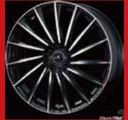
CH (ブラック/ポリッシュ)