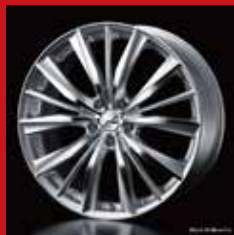
VX (シルバー/ポリッシュ)