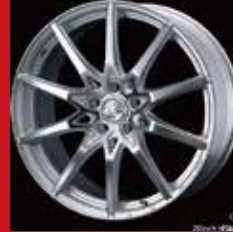
SV (シルバー/ポリッシュ)