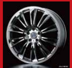
ベータ (ポリッシュ)