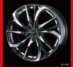
TE (ブラック/ポリッシュ)