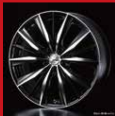
VX (ブラック/ポリッシュ)